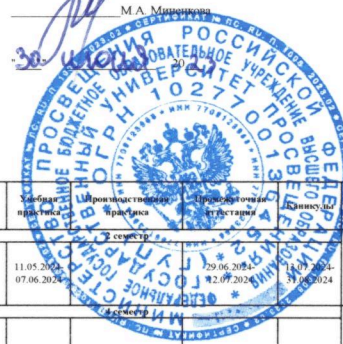
Календарный учебный график для студентов 2023 года начала подготовки

УТВЕРЖДАЮ Начальник управления организации и контроля качества образовательной деятельности