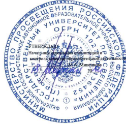
Календарный учебный график для студентов 2024 года начала подготовки