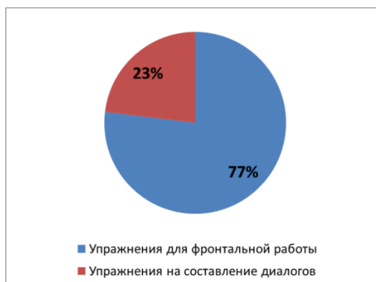
Диаграмма 1. Процентное соотношение различных видов упражнений, направленных на формирование навыка говорения

ВКР должна быть написана в соответствии со стилистическими особенностями научного изложения. При описании фактов, явлений и процессов в тексте ВКР используются безличные, неопределенно-личные предложения . Номинативные предложения применяются в названиях разделов, глав и параграфов, в подписях к рисункам, диаграммам, иллюстрациям.