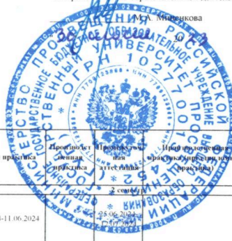
Календарный учебный график для студентов 2023 года начала подготовки

УТВЕРЖДАЮ Начальник управления организации и контроля качества образовательной деятельности Мисеникова