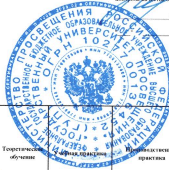
Календарно-учебный график для студентов 2023 года начала подготовки

Факультет: Физико-математический Форма обучения: Очная Направление подготовки 44.03.05 Педагогическое образование (с двумя профилями подготовки) Профиль: Математика и физика Срок получения образования: 5 лет Квалификация: Бакалавр